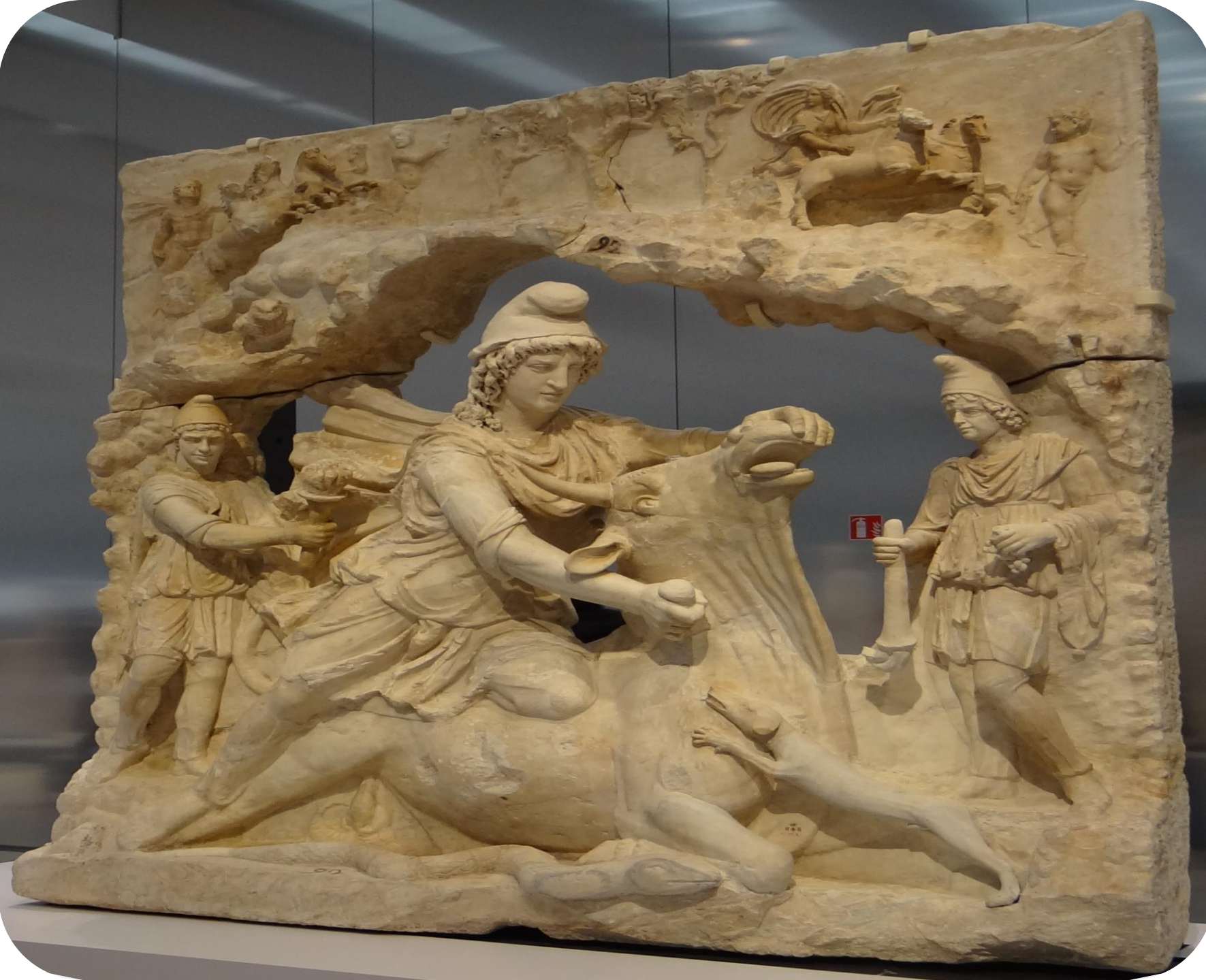
Mithra la Galerie du Temps du Louvre-Lens