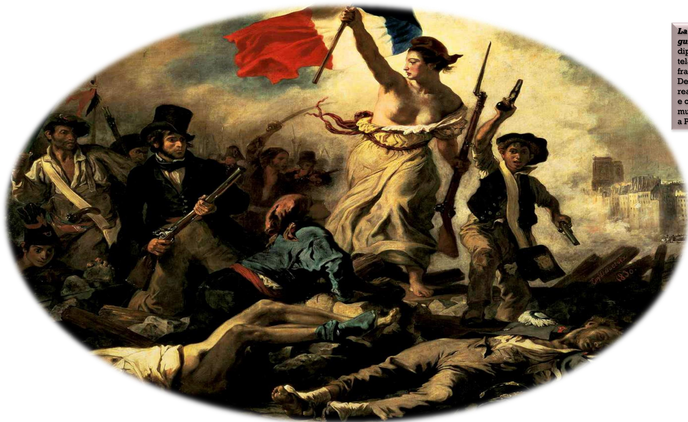
La Libertà che guida il popolo dipinto a olio su tela del pittore francese Eugène Delacroix, realizzato nel 1830 e conservato nel museo del Louvre a Parigi